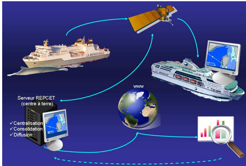
Schéma global de fonctionnement

L'outil REPCET est un système logiciel dédié à la navigation commerciale. Il vise, prioritairement, à limiter les risques de collisions entre les grands cétacés et les navires de commerce.